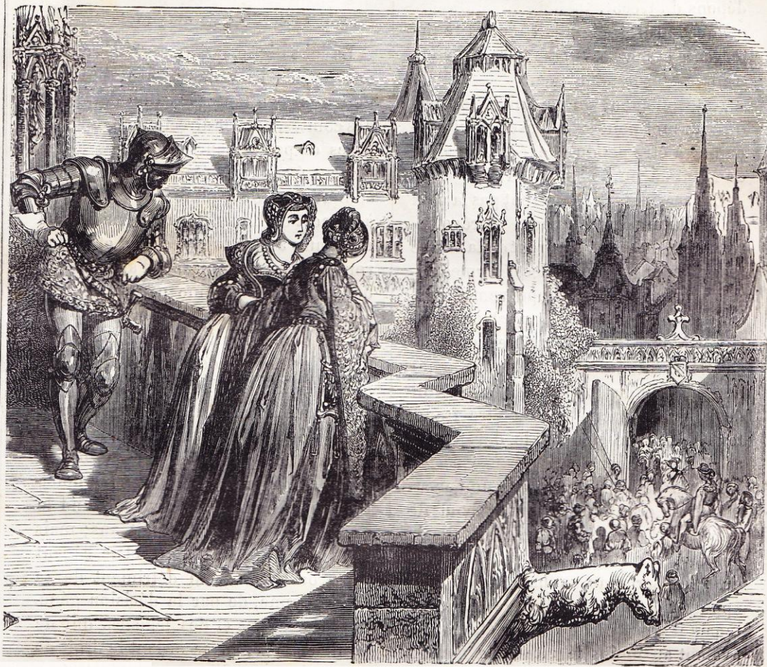
Isabeau, reine d'Angleterre, assistant au défilé des bourgeois (1313).

de celui de battre monnaie; ils voulaient aussi l'abolition de la procédure par dépositions écrites, qui rendait les hommes de loi seuls instruments des justices royales; ils eurent le tort de le dire trop tôt, car les communes virent alors que les seigneurs ne tenaient qu'à la restauration de leurs privilèges et abandonnèrent leur alliance, ce qui permit à la royauté d'en avoir assez vite raison.