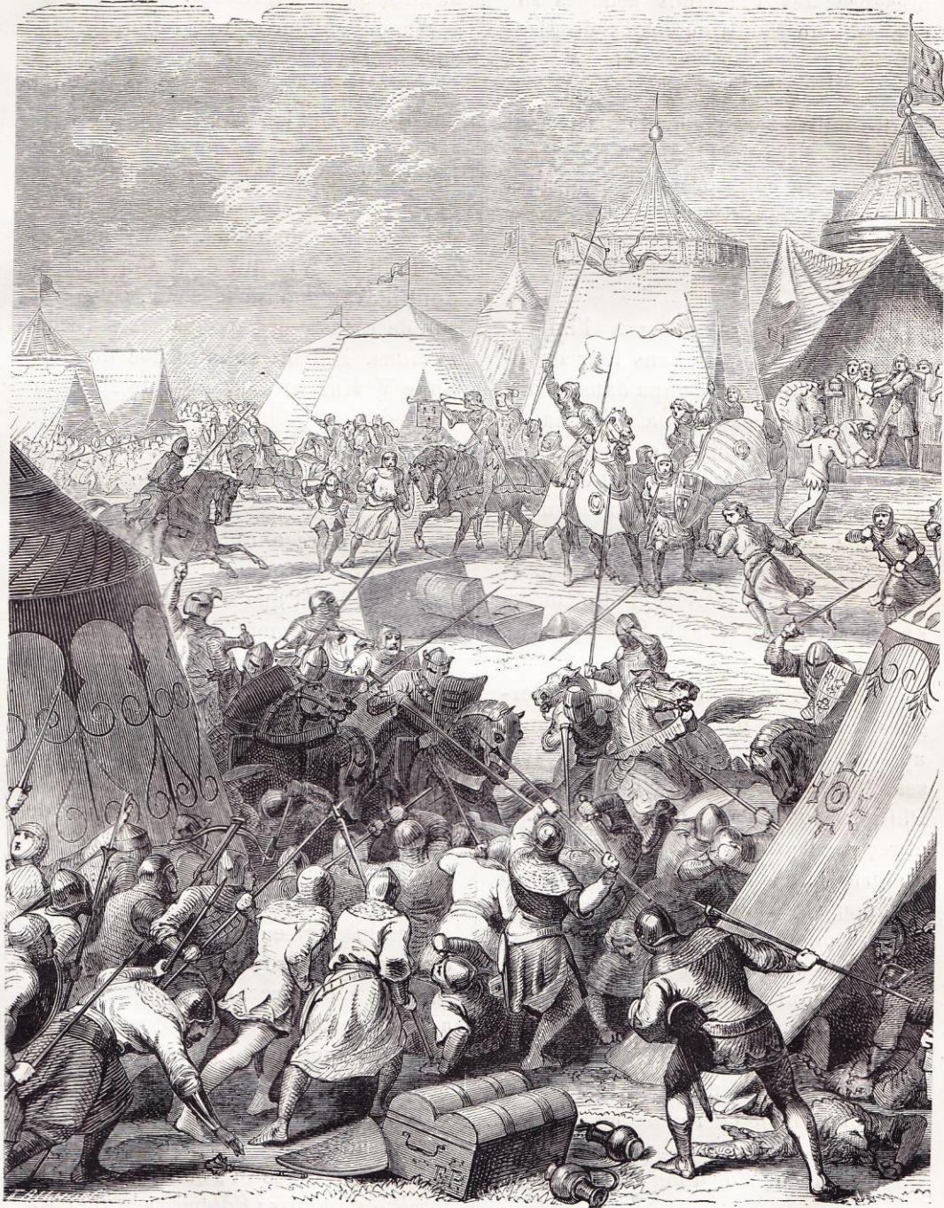
Bataille de Cassel (23 août 1328).